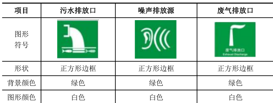
表 5-2 各排污口（源）标识牌设置一览表

建设单位应如实填写《中华人民共和国规范化排污口标志登记证》的有关内容，由生态环境主管部门签发登记证。建设单位应把排污口情况如排污口的性质、编号、排污口的位置以及主要排放的污染物的各类、数量、浓度、排放规律、排放去向以及污染治理实施的运行情况建档管理，并报送环保主管部门备案。建设单位应该在排放口处设立或挂上标志牌，标志牌应注明污染物名称以警示周围群众，执行《环境图形标准排污口（源）》（GB15563-1995），详见下表。