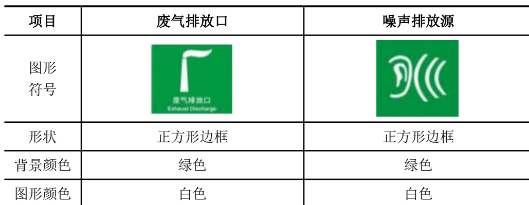
表 5-2 各排污口（源）标识牌设置一览表

建设单位应如实填写《中华人民共和国规范化排污口标志登记证》的有关内容，由生态环境主管部门签发登记证。建设单位应把排污口情况如排污口的性质、编号、排污口的位置以及主要排放的污染物的各类、数量、浓度、排放规律、排放去向以及污染治理实施的运行情况建档管理，并报送环保主管部门备案。建设单位应该在排放口处设立或挂上标志牌，标志牌应注明污染物名称以警示周围群众，执行《环境图形标准排污口（源）》（GB15563-1995），详见下表。