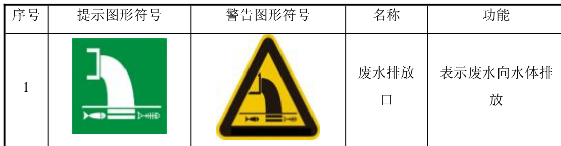
表 4-15 环境保护图形符号一览表

废气排放口、水污染物排放口和固体废物堆场应按《环境保护图形标志—排污口（源）》（GB15562.1-1995）规定，设置统一制作的环境保护图形标志牌，污染物排放口设置提示性环境保护图形标志牌；医疗废物贮存场所应按《医疗废物专用包装袋、容器和警示标志标准》（HJ421-2008）规定，统一设置标识标牌。