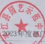
2023年度部门整体支出绩效评价基础数据表