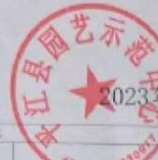
2023年度部门整体支出绩效自评表