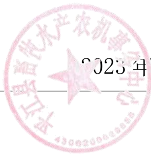
2023年度部门整体支出绩效评价基础数据表